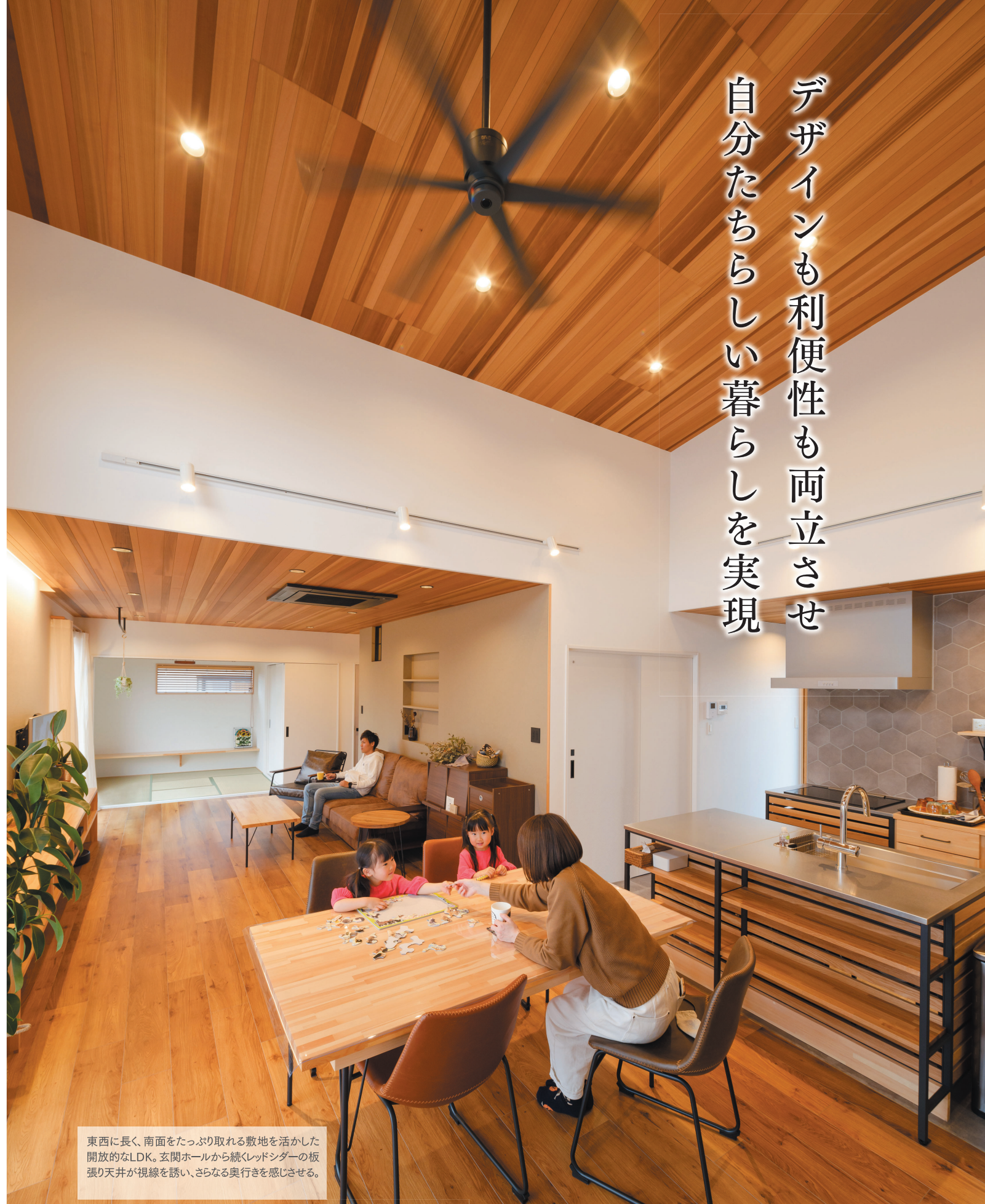
東西に長く、南面をたっぷり取れる敷地を活かした開放的なLDK。玄関ホールから続くレッドシダーの板張り天井が視線を誘い、さらなる奥行きを感じさせる。